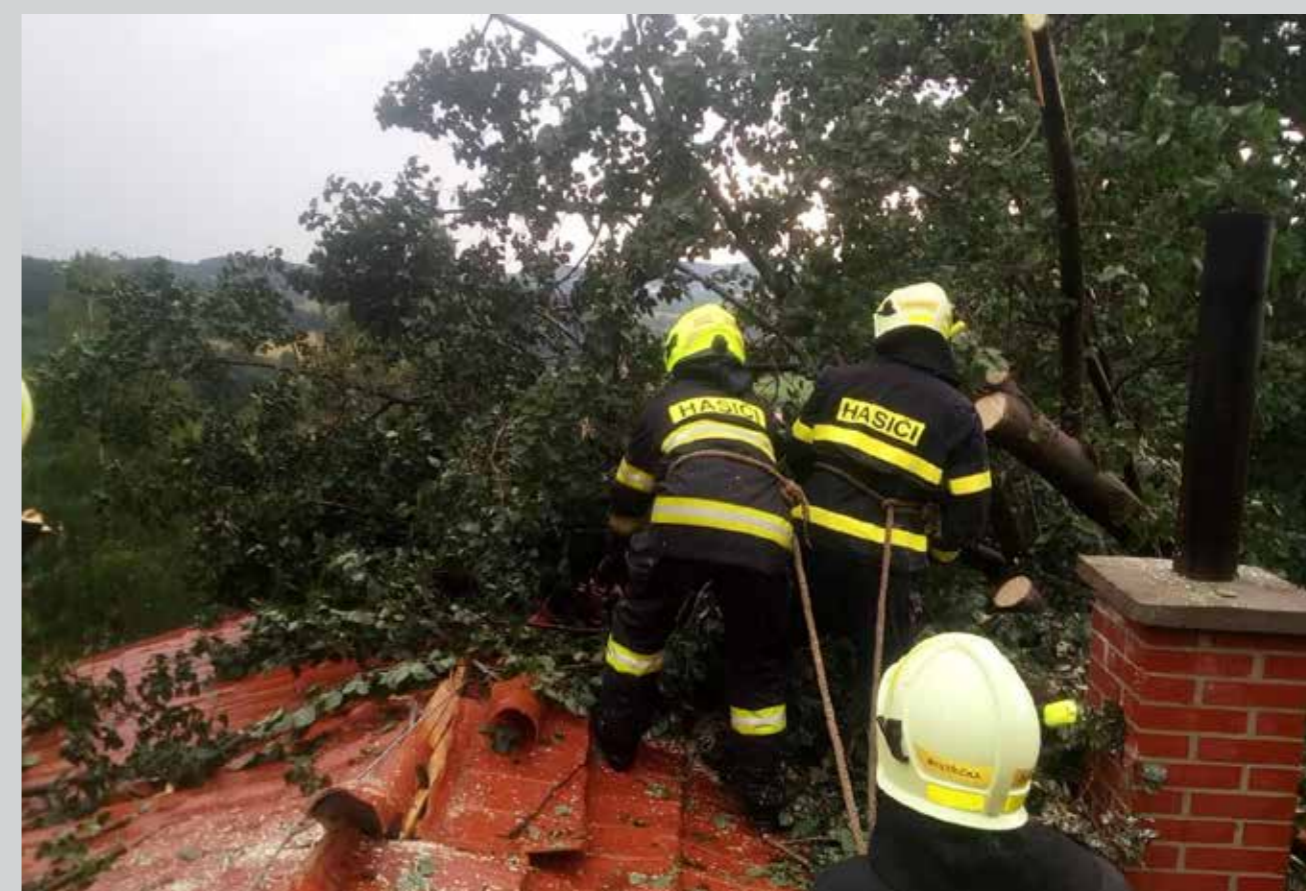
Zásah členů výjezdové jednotky SDH Bystřička po pádu stromu na střechu rekreačního objektu