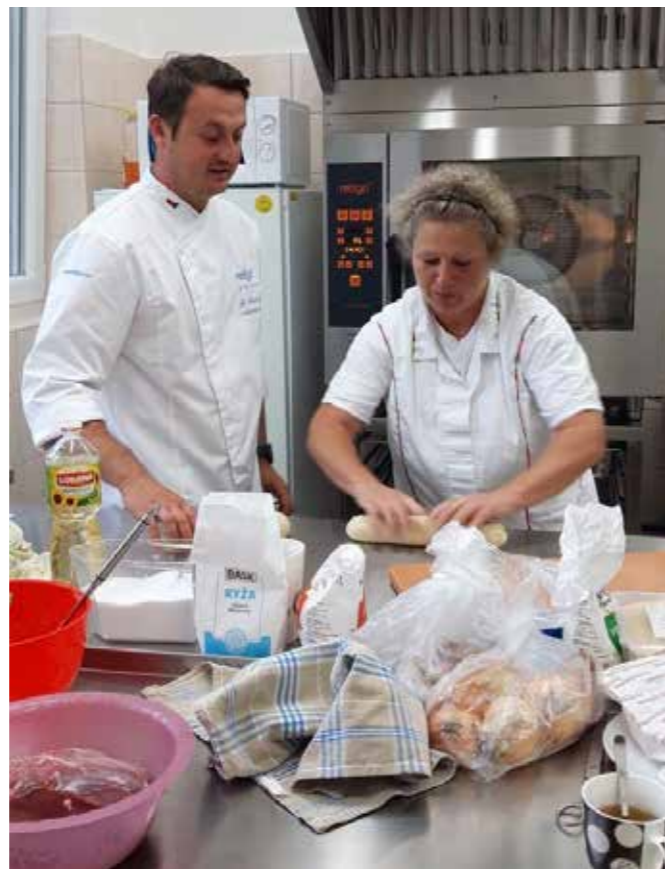
Zkušební provoz kuchyně MŠ pod vedením odborníka