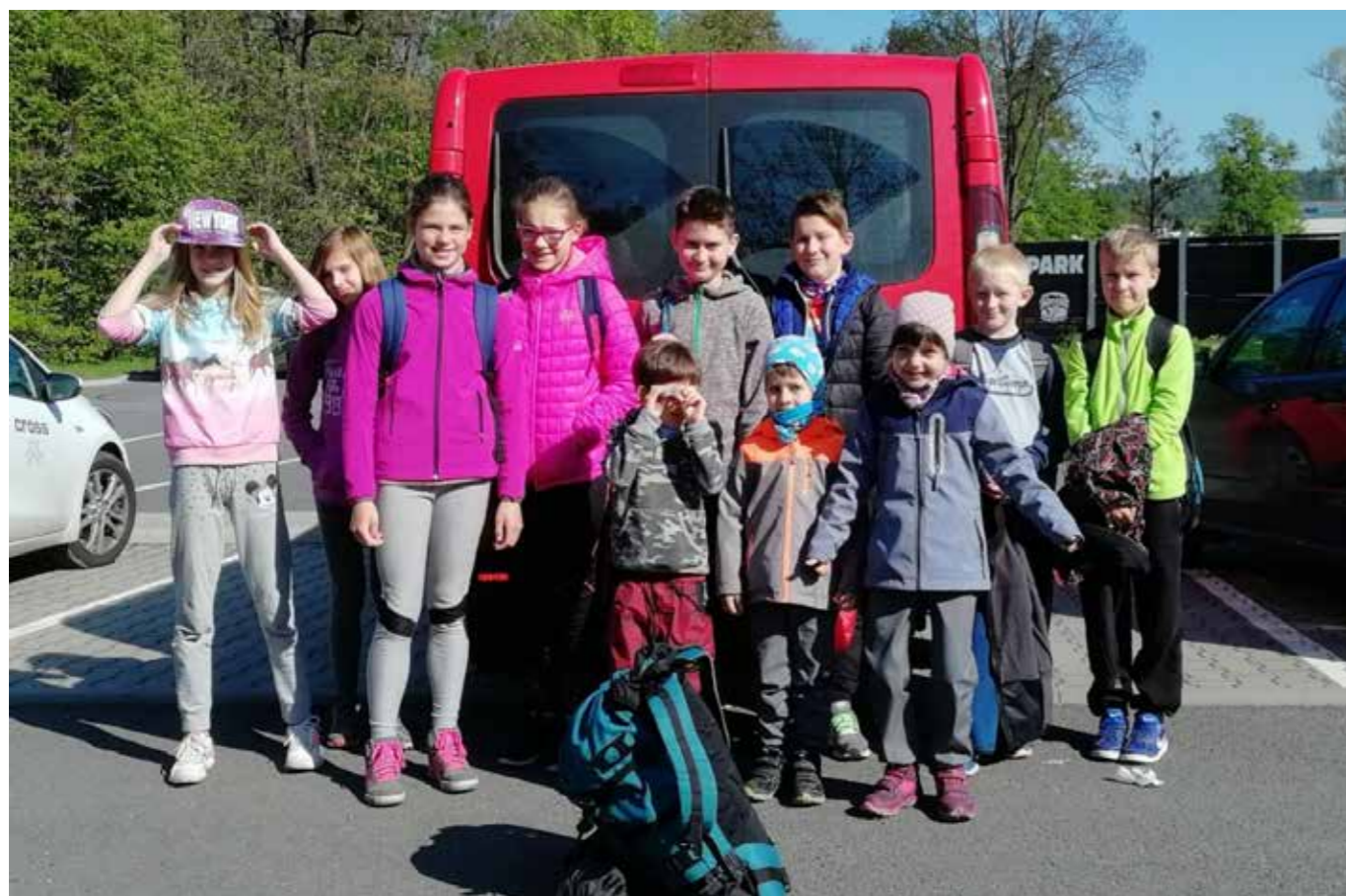
Účastníci Medvědí stezky 2019

V sobotu 8. května 2019 osm dětí z obce Bystřička a děti s rodiči, reprezentovaly TJ Sokol Bystřička v závodě v přespolním běhu a to v soutěži mládeže v přírodě MEDVĚDÍ STEZKA-OU. Soutěž se konala v Rožnově pod Radhoštěm ve SKI areálu Bučiska. Děti ve dvoučlenných hlídkách podle kategorií překonávaly překážky, plnily úkoly na stanovištích např. orientace, azimuty, hod na cíl, topoznačky, přírodovědné a vlastivědné znalosti, součinnost členů hlídky, zdravotvěda, odhad vzdálenosti, práce s mapou a buzolou, šplh, uzlování a další táborské dovednosti.