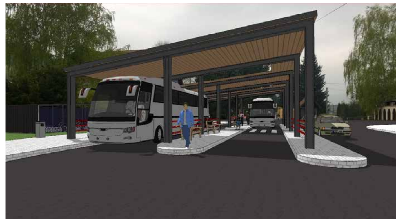
Perspektiva Dopravního terminálu Bystřička

Vážení občané, jak jste si mohli všimnout, stavební práce na investiční akci „Dopravní terminál Bystřička“, i když se značným zpožděním díky výběrovému řízení, byly zahájeny. Nejvhodnější nabídku podala firma Stavby, opravy a údržba silnic, s.r.o. Velké Albrechtice. Po uplynutí všech legislativních lhůt byla dne 26. 8. 2019 podepsána smlouva s dodavatelem a zároveň došlo k předání staveniště, aby mohly být zahájeny stavební práce, které by měly probíhat 180 dnů ode dne podpisu Smlouvy o dílo.