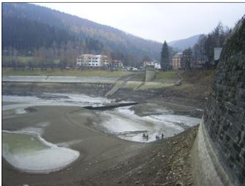
Vypouštění a výlov přehrady (listopad 2003)

Ve stálém pracovním poměru 4 Civilní služba 1 Obecní úřad nyní uvažuje o zřízení místa stážisty z pracovního úřadu, které by jim bylo plně hrazeno.