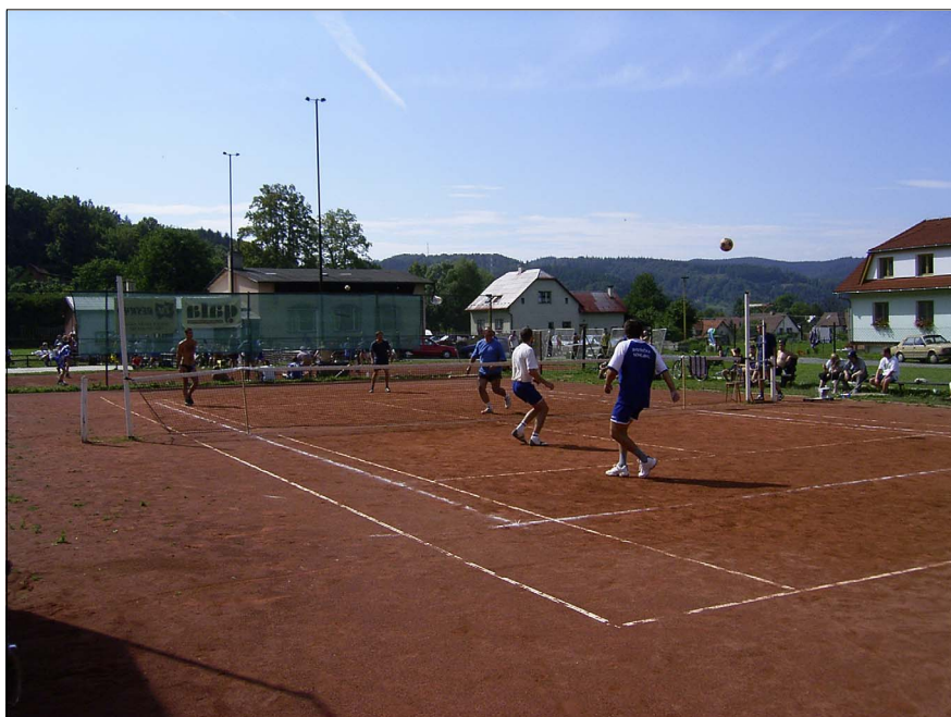
Bystřičská smeč 2003