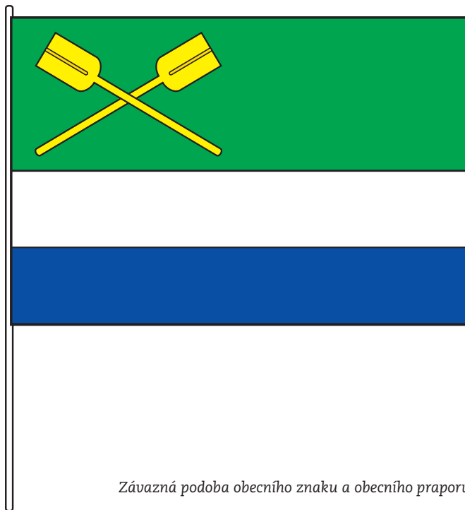
Závazná podoba obecního znaku a obecního praporu