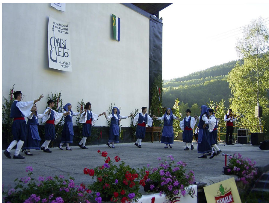
Folklorní festival Babí léto 2004

Občanská inzerce je zdarma. Inzeráty je nutno podávat v písemné formě na OÚ, nebo e-mailem.