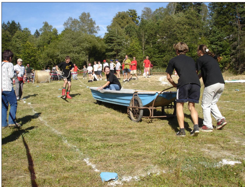
Bystrčická olympiáda 2004

Pokud nám však naše paměť bude nenápadně vynechávat