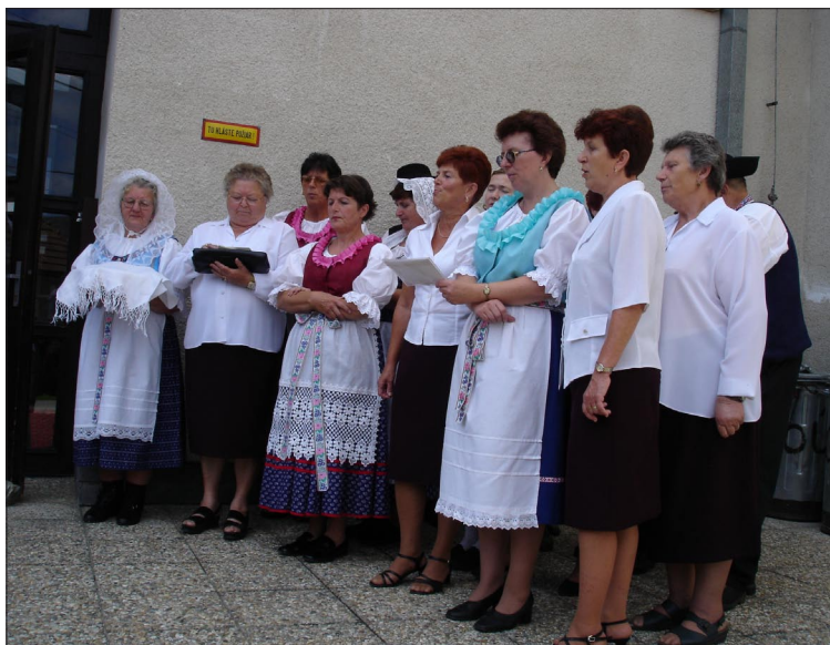
Přivítání v družební obci Bystrčeka

Večerní veselice se zúčastnil velký počet místních ob-