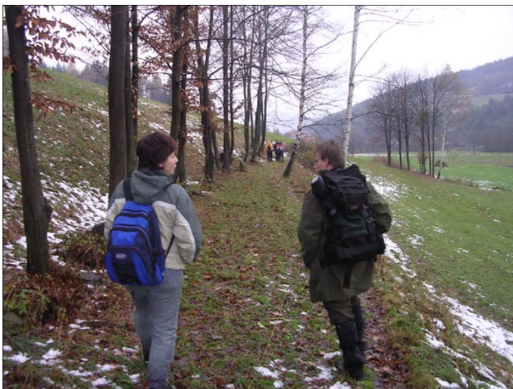
Po stopách „koňské“ dráhy (listopad 2006)

3955 m 3 , z toho 80% jsou těžby výchovné tj. probírky a jen 20% jsou těžby mýtní, tj. holoseče. Do konce LHP nám zbývá ještě vytěžit 200 m 3 mýtní těžby a 550 m 3 probírek.