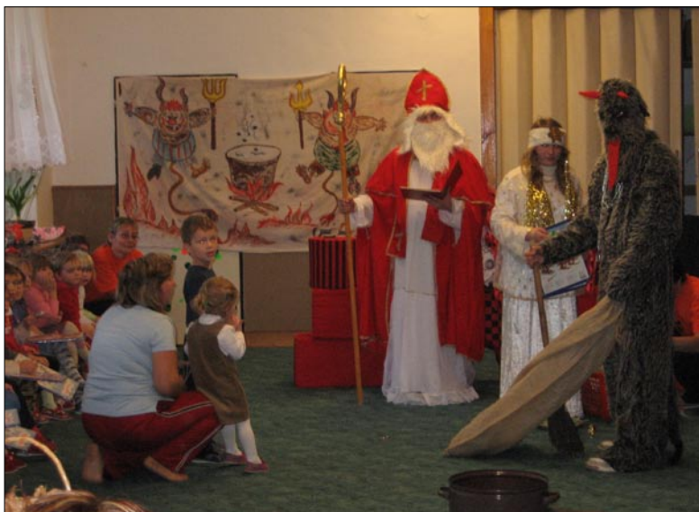
Mikuláš v MŠ Bystřička-Jeřabinka

Odvoz komunálního odpadu z pondělního dne 25. 12. 2006 je přeložen na pátek 22. 12. 2006. Pravidelný svoz začíná v pondělí 8. 1. 2007 a následuje každý sudý týden.