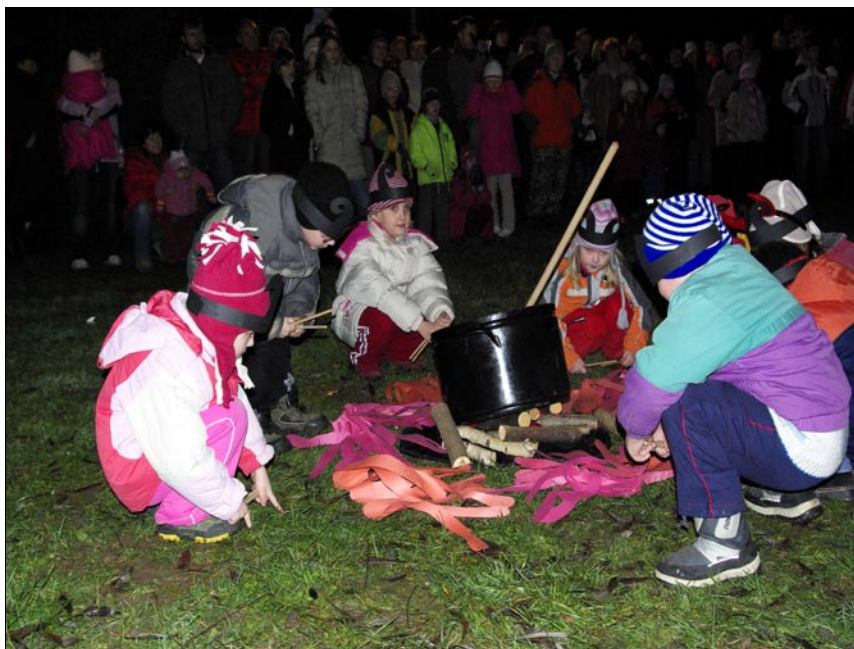
Mikuláš 8. 12. 2007

Druhá priorita, která navazuje na zbudování obecní kanalizace je cestovní ruch. V této oblasti je naším úkolem nejen zlepšení služeb v lokalitě přehrada Bystřička, ale především příprava vhodných podmínek pro možné investory v oblasti cestovního ruchu. Tato úloha je mnohem složitější než výstavba kanalizace, kterou si objednáme u dodavatele v době kdy budeme mít prostředky na její výstavbu. Přízeň potenciálních podnikatelů v této oblasti však nelze koupit. Lze však přízeň získat nikoliv krátkodobou, nýbrž dlouhodobou podporou a spoluprací se všemi, kteří jsou odhodláni v cestovním ruchu pracovat. Turistický potenciál, kterým naše obec disponuje je velký a proto je třeba jej využít v té největší míře. Pro obec to znamená především finanční prostředky, které do rozpočtu přicházejí z poplatků v cestovním