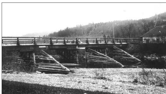
Dřevěný most přes Bečvu u nádraží na Bystřičce, 1910