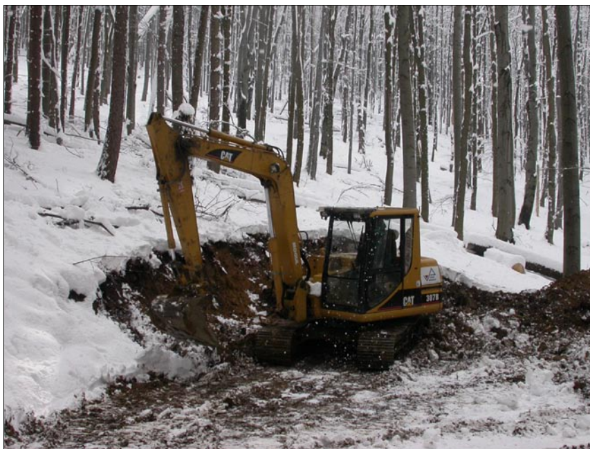
Budování přibližovací linky v Klenově

Poplatky se hradí do 31.3.2008. Žádáme občany, aby tento termín pro úhradu poplatků byl dodržen. Předjdeme tak nepopulárním výzvám k úhradě, či vystavení platebního výměru.