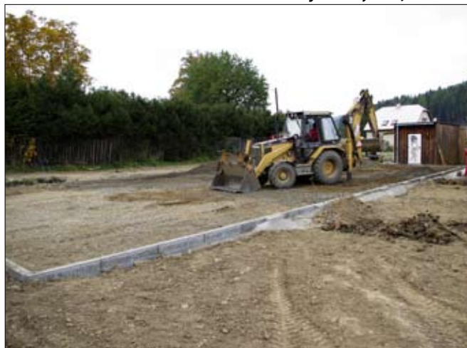
Vznik nového hřiště