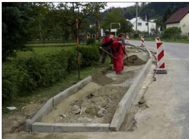
Stavba nových chodníků