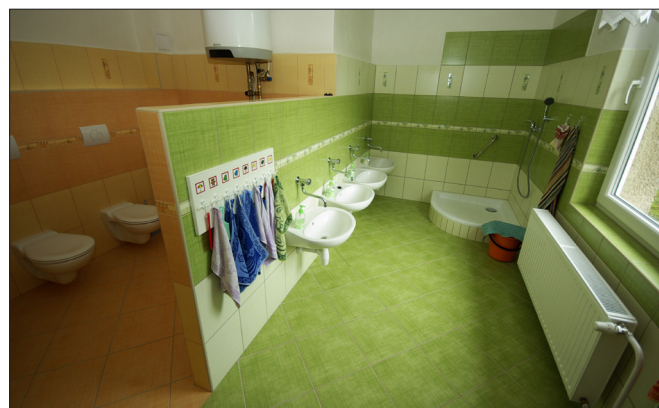
Část nových sociálních zařízení v mateřské školce

Tak jako každý rok si Obec Bystřička dovoluje pozvat všechny děti, rodiče, babičky i dědečky na tradiční MIKULÁŠKOU BESÍDKU, která se uskuteční v sobotu 5.12.2009 od 17:00 hodin u osvětleného vánočního stromku v okolí prostor hasičské zbrojnice.