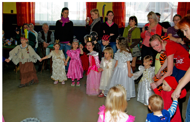
Dětský karneval 2011

V loňském roce na poplatcích za likvidaci komunálního odpadu obec vybrala částka 398.806,- Kč. Za tyto služby jsme firmě, která pro naši obec likvidaci odpadů provádí, zaplatili částku 728.360,- Kč. Rozdíl mezi příjmovou částkou a výdajovou je tedy 329.554,- Kč, kterou obec