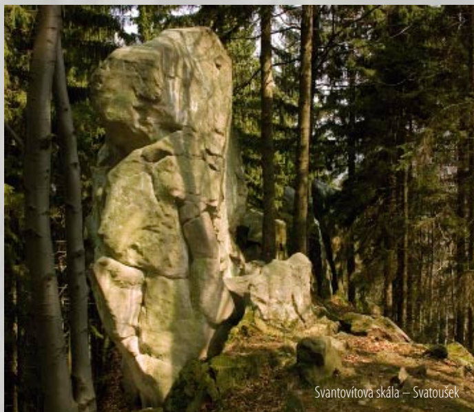
Svantovítova skála – Svatoušek

Z horolezeckého hlediska jde o nejzajímavější skalní útvar v okolí vrchu Klenov. Jedná se o šedesátimetrovou skalní zeď rozdělenou do tří věží (Ploutev, Svatka a Svatoušek), která je vyvrcholením skalního hřebetu od vrcholu Štípa (707 m n. m.). Lokalita byla lezecky objevena až v 60. letech a v současnosti je zde vytyčeno kolem třiceti lezeckých cest převážně středních a vyšších stupňů obtížnosti ve stěnách do výšky deseti metrů. Z vrcholu Ploutve je nádherný výhled na údolí Malé Bystřice, Santov a Búřov. Dosažení vrcholu bez horolezecké výbavy však není jednoduchou záležitostí.